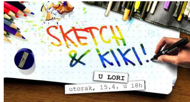
Kreativno druženje, travanj