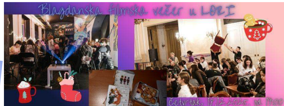
Blagdanska filmska večer u LORI, prosinac