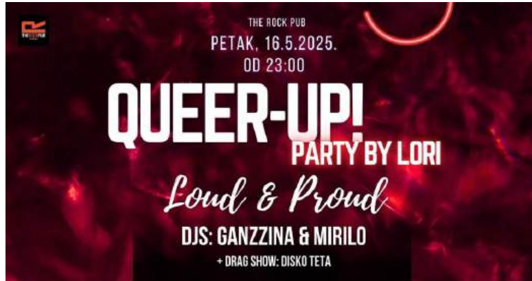
Queer UP! Party, svibanj, listopad