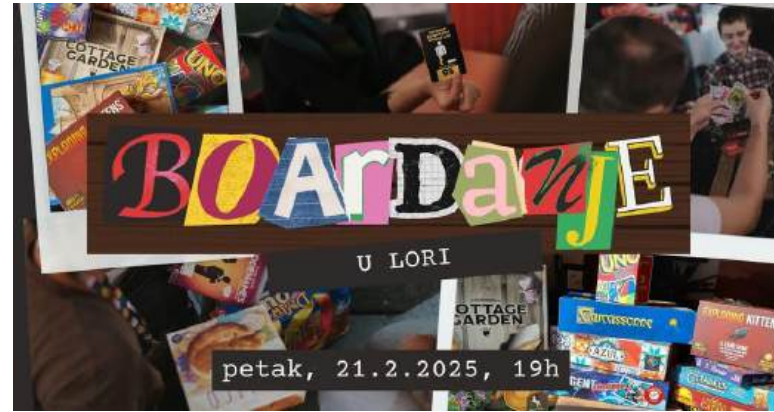
Društvene igre u LORI vol.2, veljača

+ različiti društveni sadržaji organizirani u okviru programa Queer i feministička kultura